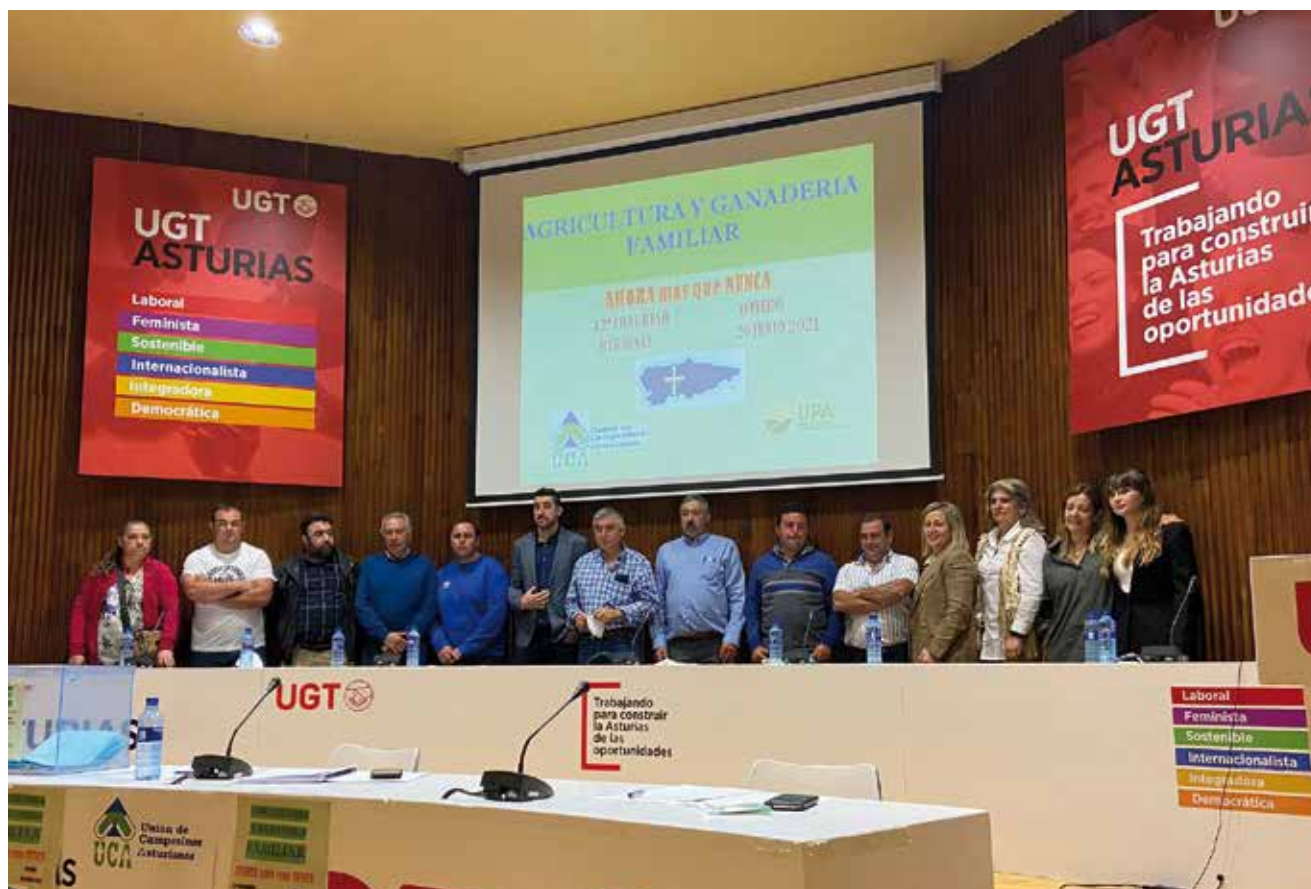
Foto de familia de la nueva Ejecutiva de UCA en la sede de UGT Asturias