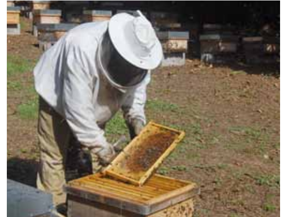
Año amargo de miel