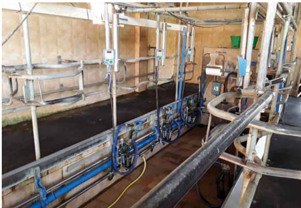
Sala de ordeño y nave de estabulación

El ganado pasta casi todo el año, aunque siempre duerme en la cuadra, para ello cuenta con alguna finca, aunque la mayoría son alquiladas. Y en el día a día tiene sus encontronazos con el jabalí, que en esa zona “es exagerado los que hay, es una plaga” hasta tal punto llegan los daños de estos animales en una zona además que es urbana, que “la